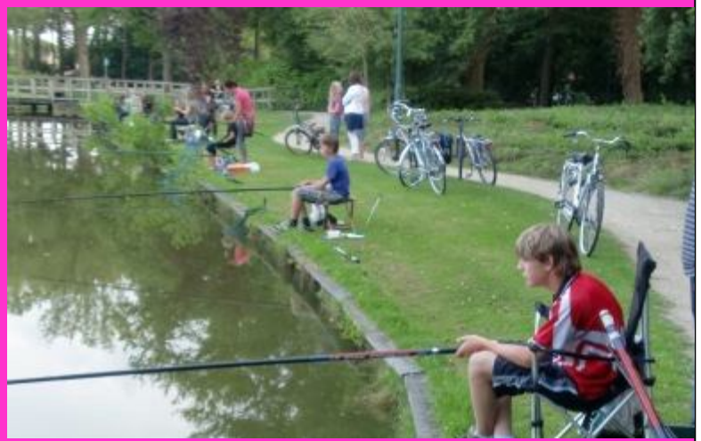
Foto wedstrijd de Borchmolen.

Helaas zijn er dit jaar geen foto's ingezonden