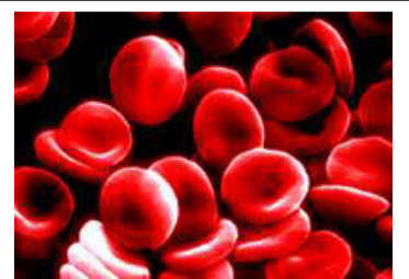
Dit zijn rode bloedcellen.