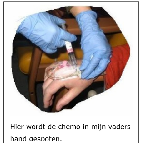
Hier wordt de chemo in mijn vaders hand aespoten.