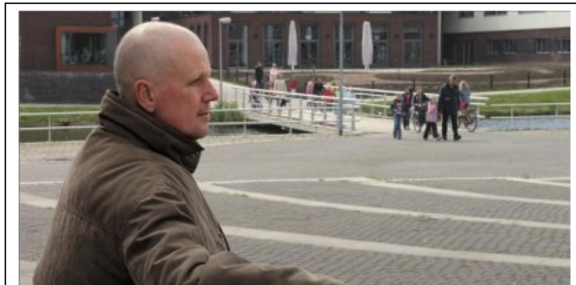
Hier was mijn vader kaal geworden door de chemo's

Mijn vader moest toen ook chemo's krijgen. Een chemo duurt 1 maand, maar daar vertel ik ook meer over in het hoofdstuk behandelingen. Mijn vader krijgt nu ook chemo's. Mijn vader is door de chemo kaal geworden. Hier is er een foto van.