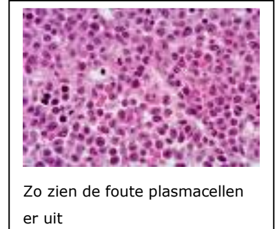
Zo zien de foute plasmacellen er uit

En er is nog iets wat de ziekte doet. Het maakt je botten zacht zodat ze sneller kunnen breken en instorten. Bij mijn vader is een ruggenwervel ingestort. En dat kan heel gevaarlijk zijn.