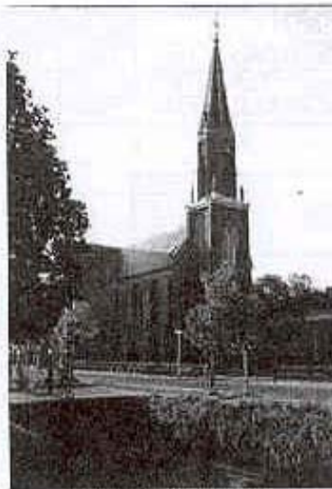
Katholieke kerk H. Marinus