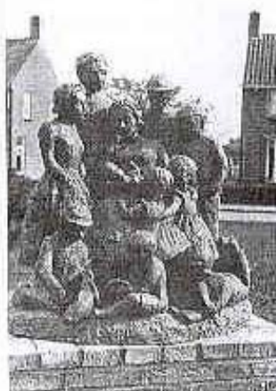
Het beeld van Afkes Tiental