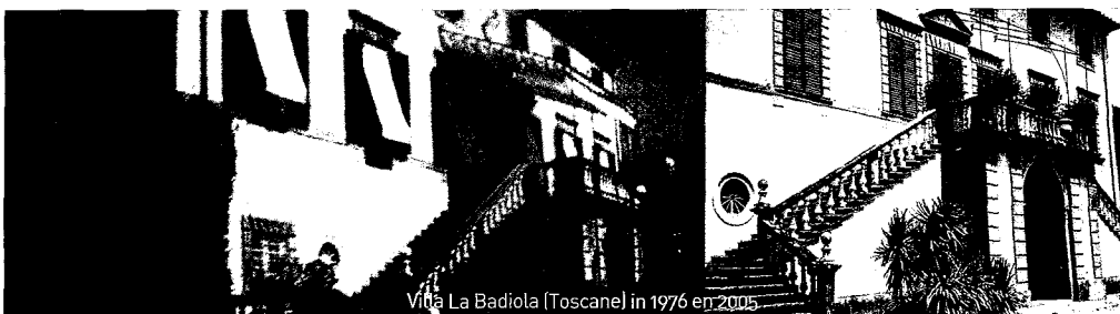
Villa La Badiola (Toscane) in 1976 en 2005

A ls je vandaag de dag als toerist rondloopt in de Romeinse Galleria Colonna, herinnert niets eraan dat dit voornaam en kolossale stadspaleis dertig jaar geleden de filmset was voor Luchino Visconti's laatste film, L'innocente (1976). Behalve in het Palazzo Colonna, waar hij aan het begin van zijn film twee kamerconcerten situeerde, filmde hij in twee villa's in Toscane, maar zijn belangrijkste set was de negentiende-eeuwse Villa Mirafiori. Deze Romeinse villa werd in 1874 gebouwd voor 'la bella Rosina', de morganatische echtgenote van koning Victor Emmanuel II. Precies honderd jaar later functioneerde het als de woning van Tullio Hermil, de hoofdpersoon van L'innocente .