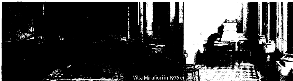
Villa Mirafiori in 1976 en 2005